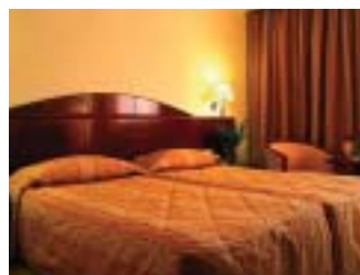
EL MOURADI AFRICA 5★ TUNIS