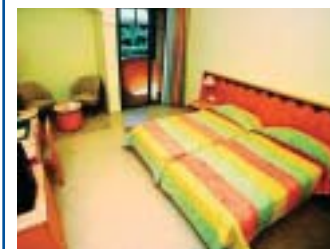
KZAR ROUGE 4★SUP TOZEUR