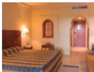
ALHAMBRA THALASSO & SPA 5★ HAMMAMET